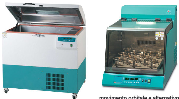
movimento orbitale e alternativo